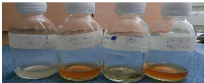
شکل (۱-۱). نمونه تصویر در فصل یک